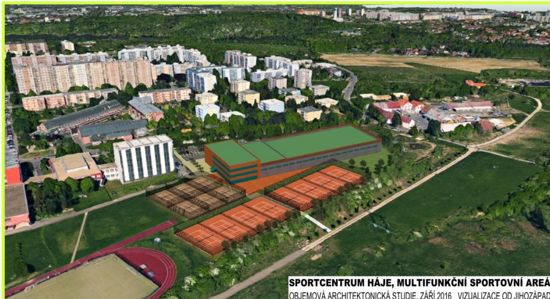
SPORTCENTRUM HÁJE, MULTIFUNKČNÍ SPORTOVNÍ AREÁL OBJEMOVÁ ARCHITEKTONICKÁ STUDIE, ZÁŘÍ 2016 VIZUALIZACE OD JIHOZÁPADU