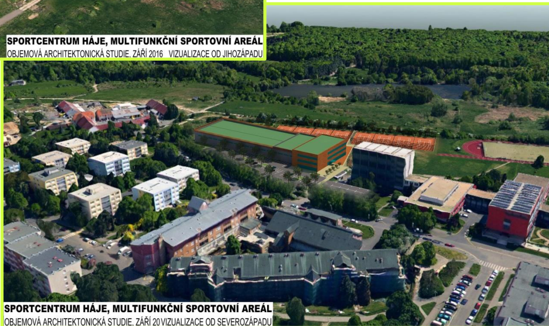
SPORTCENTRUM HÁJE, MULTIFUNKČNÍ SPORTOVNÍ AREÁL OBJEMOVÁ ARCHITEKTONICKÁ STUDIE, ZÁŘÍ 2016 VIZUALIZACE OD SEVEROZÁPADU